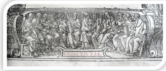
Alegoría de las XII Tablas en un libro de derecho del siglo XVI.