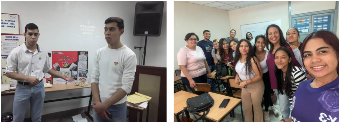
Figura 5: Socialización del conocimiento, estudiantes carrera TSU electrónica (2024) Estudiantes de metodología de la Investigación, carrera Administración (2024)