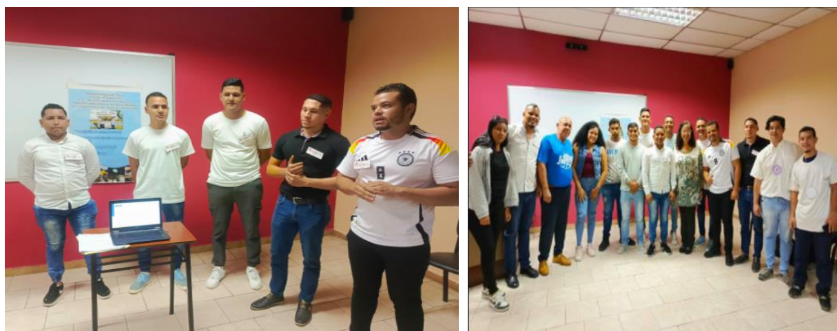
Figura 7: Socialización del conocimiento, estudiantes carrera TSU electrónica (2024)

La divulgación y por ende, socialización del conocimiento, conducirá al “convivir”, a través de la publicación de artículos, las ponencias, las defensas de los trabajos de grado y; de presentarse la oportunidad, la vinculación con grupos de trabajo de extensión comunitaria.